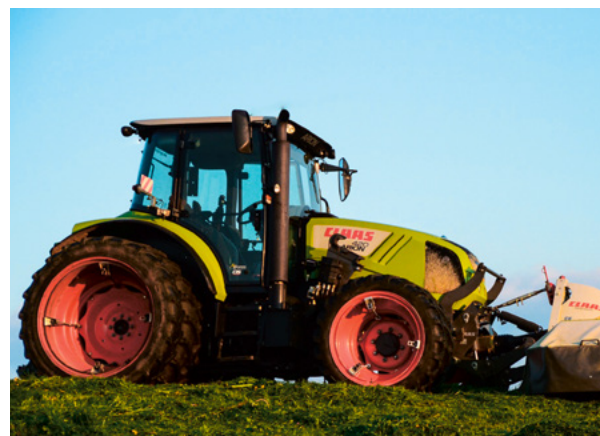
Tab. 3: Beispiel Kostenberechnung für Traktor 70 kW (95 PS), Nr. 1005.