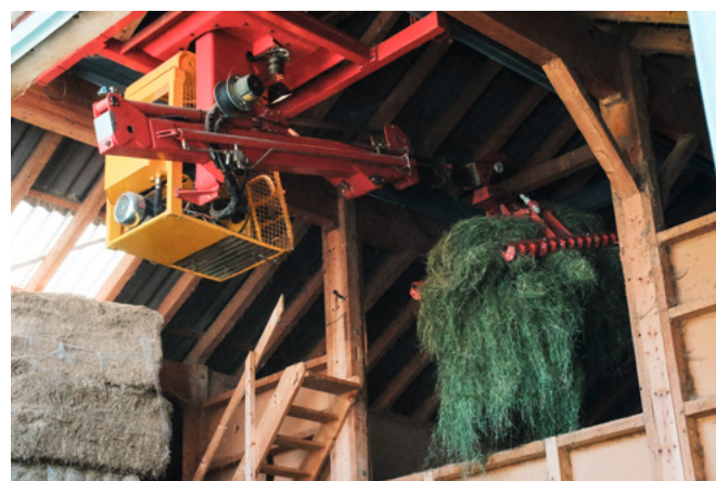
Hoftechnische Einrichtungen dienen ähnlich wie Landmaschinen der Arbeitserleichterung und Arbeitsreduktion.

Die Datensammlung der hoftechnischen Einrichtungen befindet sich direkt im Anschluss an die Datensammlung der Landmaschinen.